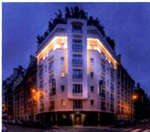
L'hôtel Félicien dans le XVI e à Paris.