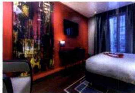
Une chambre de l'étage Ruby Floor.

C'est dans le très résidentiel XVI e arrondissement de la capitale qu'Elegancia a installé son premier hôtel couture, en association avec le créateur de mode Olivier Lapidus , qui devient pour la première fois créateur d'hôtel. Il y a imprimé son style, mariant les matériaux, utilisant leurs contrastes (le marbre brillant au sol et le Krion opaque du meuble de la réception), jouant avec les lumières tour à tour crues dans le lobby, diffuses dans les chambres, opalescentes au bar. Du sous-sol au sixième étage, tout l'hôtel est un défilé de mode. Le rez-de-chaussée plante le décor avec un sol en marbre au motif pied-de-poule et les croquis personnels du couturier au mur. Dans les chambres, les univers