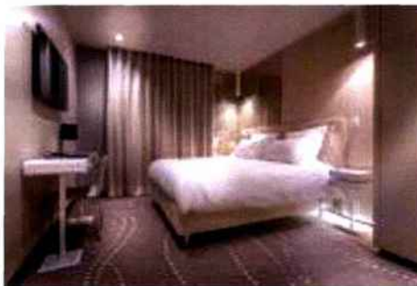
Une chambre de l'étage Pearl Floor.