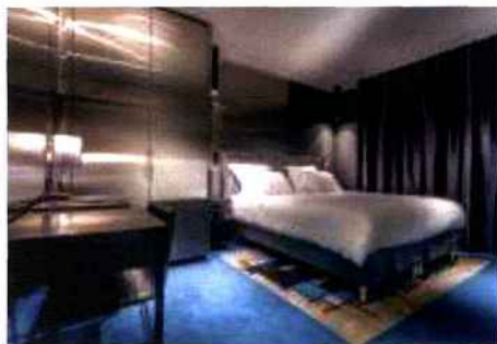
Une chambre de l'étage Couture Floor.