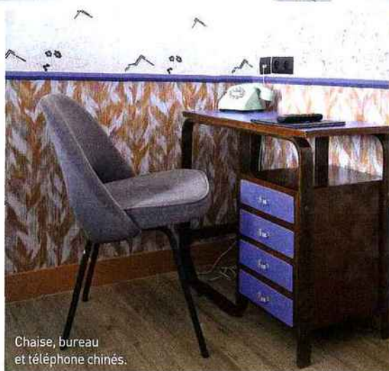
Chaise, bureau et téléphone chinés.