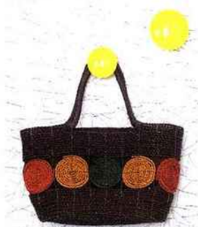
Patères « Manto » en aluminium poli (nombreux coloris), design By O pour Sentou, et papier peint « Windmill » d'Erica Winkerty, Au Fil des couleurs.

INFOS Crayon rouge. 42, rue Croix-des-Petits-Champs, 75001 Paris. Tél. : 01 42 36 54 19. Chambres à partir de 139 € la nuit. À souligner : la suite « Sans modération » dotée d'un minispa argenté, et la suite « Tendre rosée » située sous les toits. À déguster avec modération au wine bar automatique Enomatic, un verre de vin accompagné d'une planche de charcuteries ou de fromages.