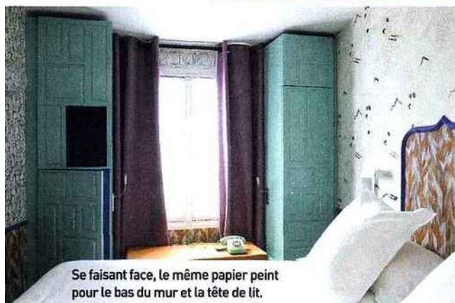
Se faisant face, le même papier peint pour le bas du mur et la tête de lit.

Table basse collection « 50's », Red Edition. De bas en haut, papiers peints « Manakin », Arte, et « Spiral » d'Erica Winklerly, Au Fil des couleurs.